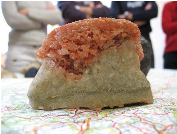
Potasse sur sel gemme