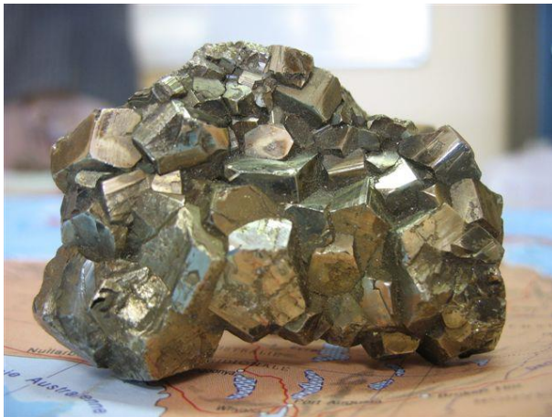
Pyrite de fer